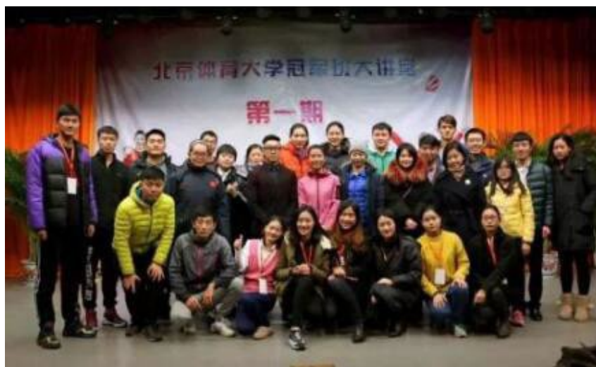
冠军大讲堂第一期主讲嘉宾及工作人员合影

研究生冠军班党支部先后主办了多期“冠军大讲堂”，例如，里约奥运会女子 20 公里竞走冠军刘虹、里约奥运会女子跆拳道冠军郑姝音、里约奥运会女排奥运冠军魏秋月、自由式滑雪空中技巧世界冠军齐广璞等担任主讲嘉宾，结合自身成长经历，与师生分享自己的学习、生活、训练中攻坚克难的案例，“让冠军讲冠军的故事”受到了全校师生的一致好评，在不断增强思政课的思想性、理论性和亲和力、针对性等方面做出了有益探索，取得了实效。