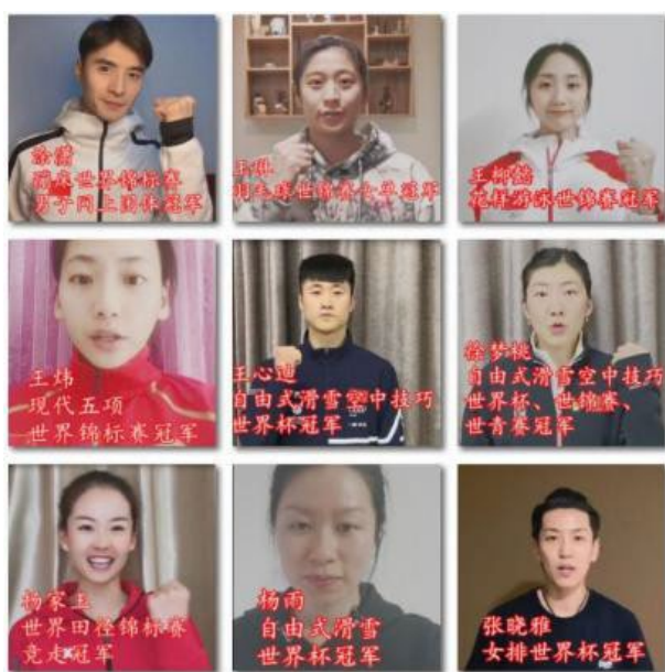
研究生冠军班的同学们为战胜疫情加油

疫情、保北京、保备战”各项工作中。党支部多次举行线上主题党日活动，如“坚定理想信念，弘扬五四精神，练就过硬本领”五四青年节主题党日活动，支部党员“云端”会面，集体重温总书记回信精神、学习研讨总书记给北大援鄂“90后”党员的回信精神和五四寄语精神、共同观看献给新一代的青年宣言片《后浪》，纷纷结合本职岗位谈防控、谈落实，进一步凝聚共识、鼓舞士气、振奋人心，强化“战疫有我”的集体认同和使命担当，建设“来之能战、战必能胜”的坚强战疫堡垒。