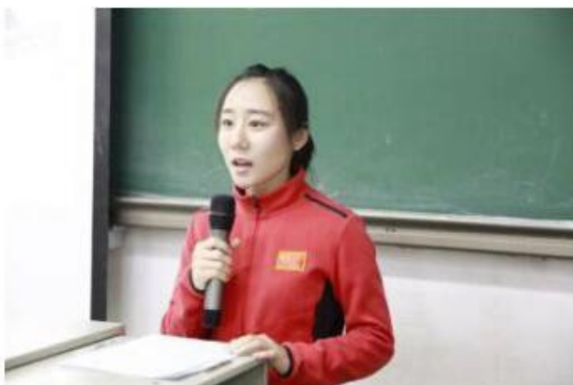
奥运冠军邓琳琳讲思政课

自创建以来，党支部深入学习贯彻落实习近平总书记 2019 年 3 月 18 日在学校思想政治理论课教师座谈会上重要讲话精神和 6 月 18 日给北京体育大学 2016 级研究生冠军班全体学生重要回信精神，深挖体育教育思政元素，深化思想政治理论课改革的有益探索，结合体育学科特点和体育院校学生特点、认知规律，进一步加强对体育学科和体育史、体育项目思政育人元素的深度挖掘，建立了由思政课教师、专业课教师和冠军党员所组成的教学协同创新团队，以点带面地推进思政课改革创新。