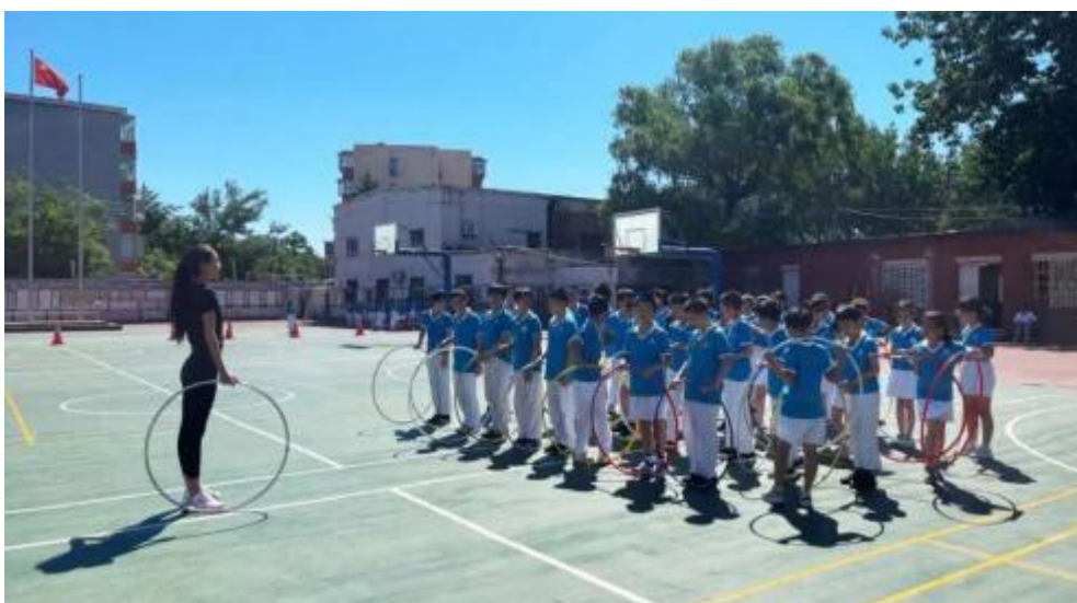
艺术体操世界冠军隋剑爽给小学生上课

党支部深刻认识到体育精神与冠军精神在助力体育强国、健康中国等方面的巨大作用，积极组织党员开展社会服务工作，在支教、扶贫、疫情防控、全民健身推广等方面做出积极贡献。每年暑期组织社会实践团，到山西阳泉、贵州遵义、吉林舒兰等地区支教，到山西繁峙、代县等地区开展体育专项扶贫，以体育的拼搏奋斗精神、冠军的追求卓越精神感染人心、点燃斗志；通过走进社区、学校、企业举办友谊赛、开展优秀运动员全民健身志愿服务活动、全民健身普及与推广活动，为大众普及奥林匹克知识、传播奥林匹克精神；党员张昊作为北京青