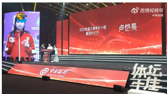
2022 级运动训练专业学子获得 2022 年浙江省“体坛十佳”最佳突破奖

吴易昺、黄雨婷分获最佳男、女运动员奖，雅思组合获得最佳团队奖，最佳体育精神奖是帆船运动员陈莎莎，射击运动员卢恺曼斩获最佳突破奖。最佳非奥运动员奖李安喆，最佳残疾人运动员奖李盼盼，最佳教练员奖夏焯泽，最美基层体育人物奖钟华燕，最佳体育产业精英奖穆旸。 □ 体坛报的微博视频