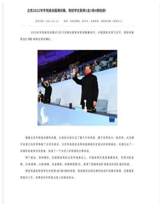
在北京 2022 年冬残奥会中，学院学子获得 1 金 1 银 4 铜佳绩