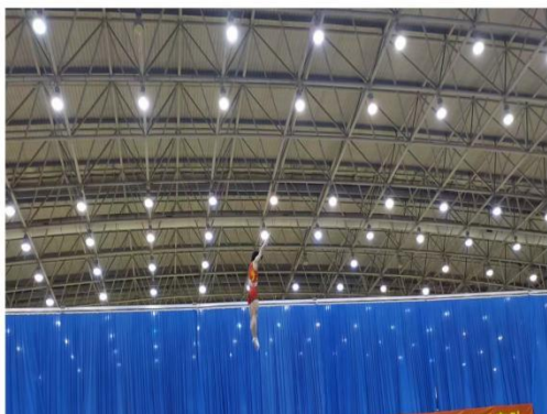
学院学子在中国蹦床冬训测验中稳居榜首

本次中国蹦床队冬训测验同时也是2024年世界杯、亚锦赛、年龄组及亚青赛选拔赛，共有男子21名、女子14名运动员参赛。