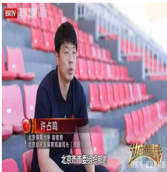
学院教师担任北京冬奥会火炬手传递副总指挥，并入选北京市委组织部，北京广播电视台承制的全国首档聚焦人才的纪实节目《为你喝彩》