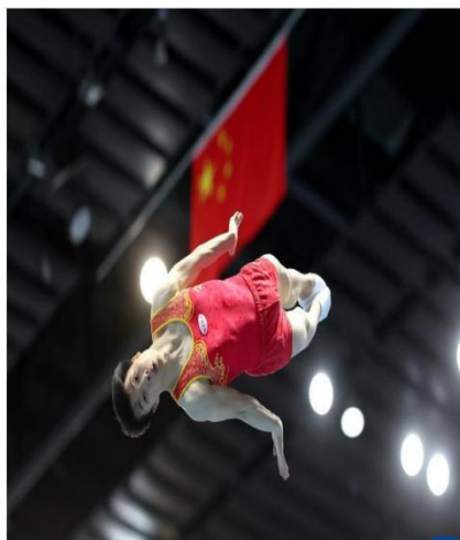
学院学子在全国蹦床冠军赛中获网上个人冠军