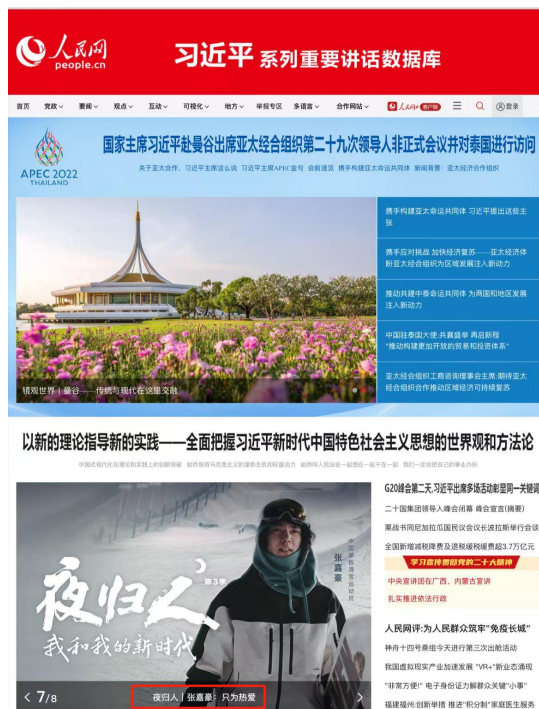
2022 级运动训练专业学子个人事迹被人民网报道（来源：人民网）