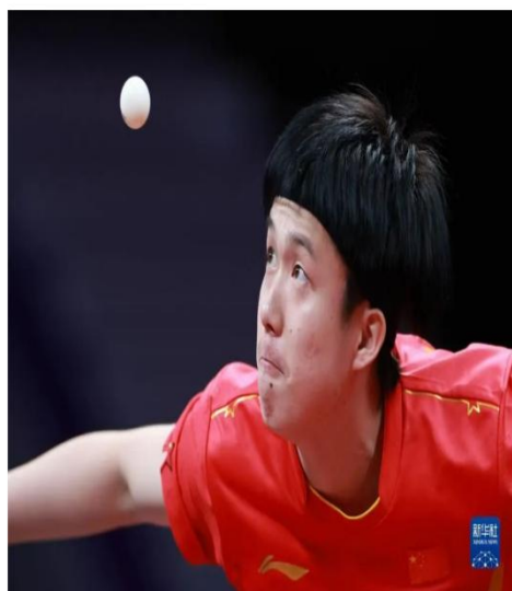
王楚钦在比赛中。